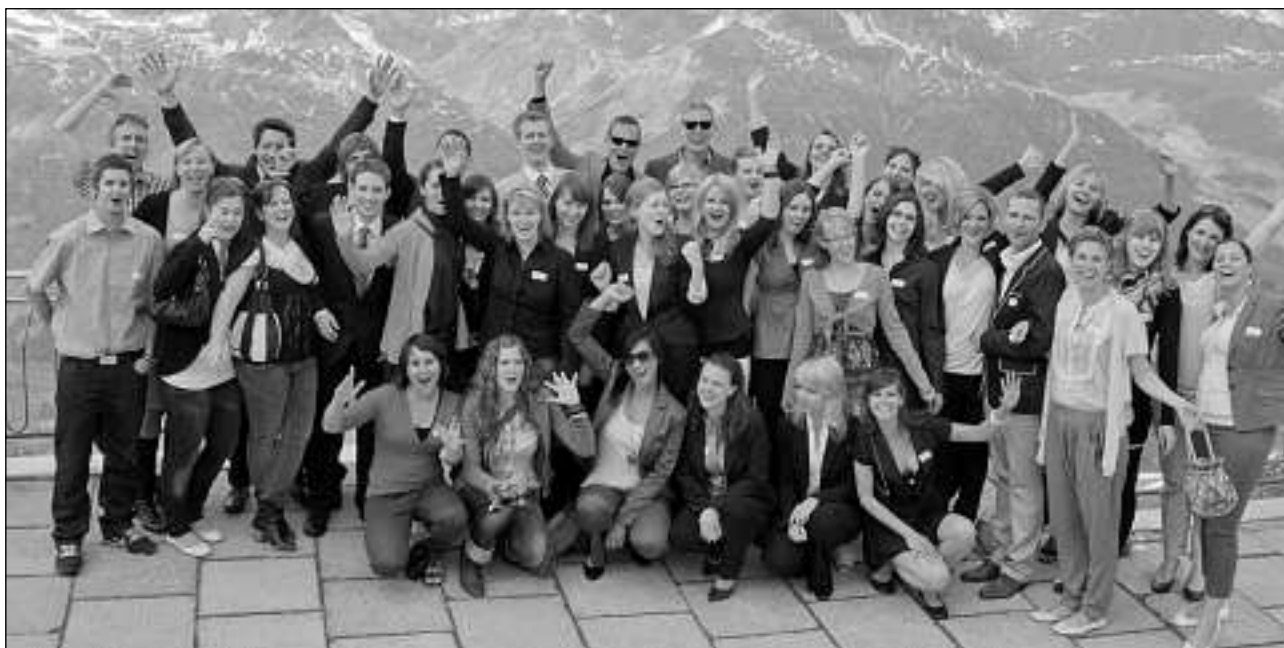
Las absolventas ed ils absolvents da la scoula da turissem a l'Academia Samedan han survgni lur diploms.