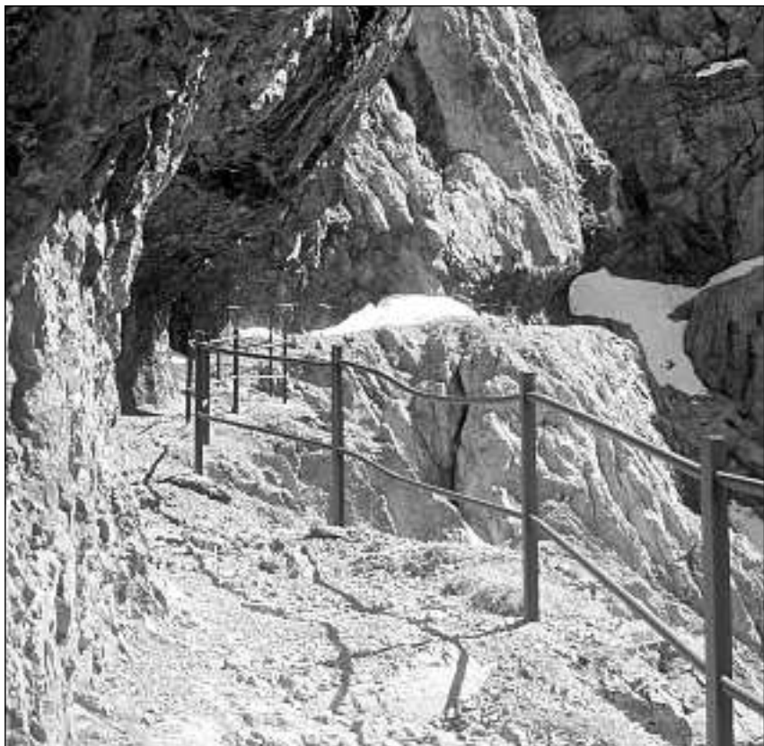
La senda dal Quar.

L'inauguraziun da la vernissascha vain festagiada prosma sonda, ils 3 lügl da las 17.00 fin las 19.00 illa Grotta da cultura a Sent. In mardi, ils 6 lügl vegnan muossadas eir dias. L'exposiziun es visitabla mincha mardi e sonda fin ils 24 lügl. Dumengia, ils 11 lügl vain realisà l'act uffizial da la commemoraziun cun üna spassegiada ed attraziuns in Val d'Uina a partir da las 10.30.