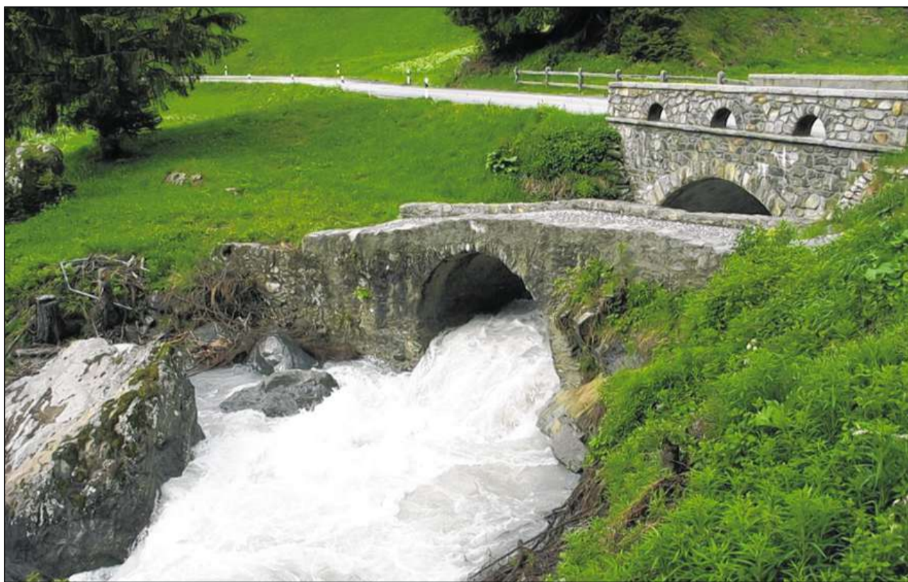
L'ouvra electrica vain fabrichada illa costa suot la punt nouva e la veglia sur il Tasnan tanter Ardez e Ftan.

La Regenza dal chantun Grischun ha approvà la mità d'avuost da quist on il proget da concessiuon e da fabrica. Ils cumüns concessiuonaris Ardez e Ftan vaivan concess unanimes il dret d'aua per ün'ouvra idraulica Tasnan fingià in avuost 2009 per mans da l'OET chi'd es lura gnüda fundada a la fin d'october da quist on. Sco cha l'OET comunichescha esa previs da cumanzar cullas lavuors principalas pella nouva ouvra electrica da primavaira dal 2013. Cullas prümas lavuors preparatoricas, sco runcadas e vias