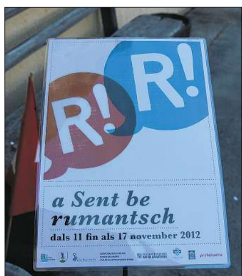
Quist'eivna vain discurrì a Sent be rumantsch.